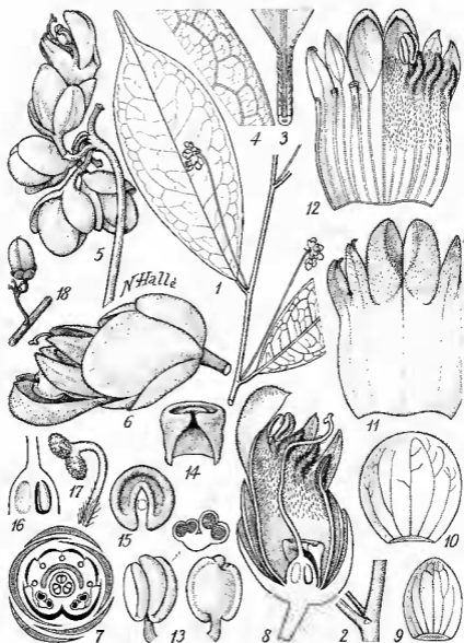
Fig. 1. — Tapura Bouquetiana N. Hallé et Heine ( Le Testu n° 9348) : 1, rameau florifère; 2, stipule; 3, pilosité du pétiole; 4, nervation du limbe; 5, inflorescence; 6, fleur de profil; 7, diagramme floral; 8, coupe longitudinale de la fleur; 9, sépale extérieur; 10, sépale intérieur; 11, corolle à plat, face externe; 12, id. face interne, pilosité supprimée à gauche; 13, anthère; 14, disque; 15, id. en vue apicale; 16, coupe de l'ovaire; 17, extrémité du style; 18, fruit juvénile ( Le Testu n° 6392). — Dimensions dans le texte.